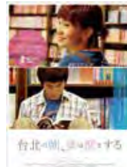
発売元:アミューズソフト