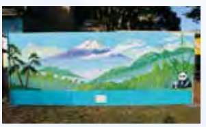
昨年の銭湯背景画

リサイクル・日用品: シルバー人材センター再生品販売、市民団体による雑貨、衣類、食器、本などのリサイクル品や贈答品、小物の販売 食べ物: たこ焼き、焼き鳥、焼きそば、お汁粉、フルーツ、赤飯、スリランカ料理、甘酒、焼き立てパン、産直青果、中華まん、飲み物などの販売 修理・PR: 包丁研ぎ(1本500円・先着順)、銭湯背景画実演、切手・年賀ハガキ販売、防犯用品展示・販売、刑務所作業品販売、ルーマニアの紹介 農産物販売: 無農薬野菜など