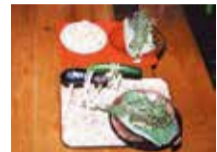
手細に見立てられたうどん(吉祥寺本町の盆行事より)

5月19日(土)~7月19日(木)(金曜・祝日を除く)/午前9時30分~午後5時/武蔵野ふるさと歴史館企画展示室/地理的特徴、江戸時代の畑作や水車稼ぎの様子、畑作の雑穀生産の農業の様子やそれに関わる風俗習慣などを紹介/協力:JA東京むさし、商工会議所/無料