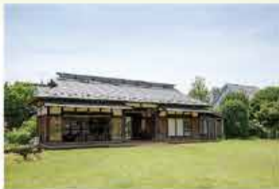
農業ふれあい公園