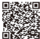
答申はこちらから

本市における小中一貫教育について検討してきた同委員会から答申が報告されました／ 閲覧 :教育企画課、市政資料コーナー、各市政センター・図書館・コミセン。市ホームページに掲載／ 問 教育企画課☎60-1972