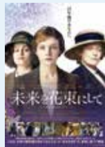
未来を花束にして