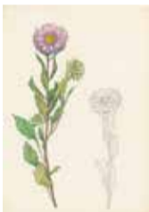
《私の鎮魂花譜》より

5月26日(土)～7月8日(日)／独学で絵を学び、自宅周辺の風景や草花を描いた作品を展示 ／一般300円・中高生100円(小学生以下・65歳以上・障害者の方は無料)