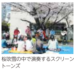
桜吹雪の中で演奏するスクリーン・トーンズ

大規模な改修工事のため、半年間という長い休館でしたが、3月20日に“新装”開館。31日には、恒例の桜まつりを開催しました。いつもは遅咲きの広場の桜も、今年は早い開花でジャストイン。絶好の花見日和となりました。オープニングを祝って駆け付けてくれたスクリーン・トーンズの青空公演。快晴の桜吹雪の下でメンバーの演奏が聴けるなんて最高!とばかり、皆さん大喜び。その後、サロンにてよさこい踊り、アコーディオン演奏、ピンゴゲームを楽しみました。 改修を終え、綺麗になった館内を見て回った方たちからは、トイレの“利便さ”“快適さ”に感動の声しきり。LEDに替わった照明の明るさや壁の塗り替えによる清潔感も好評でした。 我々スタッフも気分を新たに、皆さんのご来館をお待ちしています。