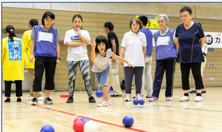
←「ボッチャ武蔵野カップ2018」の様子

当日は、ボッチャが実際にプレーできる体験会場もご用意しています。スペシャルゲストも来場しますので、ぜひ最新情報をチェックしてみてください。