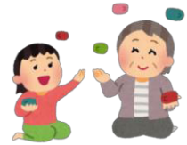
地域での子育て支援や イベント手伝い