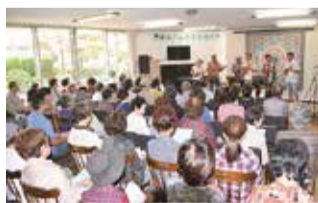
昨年の「ミュージックフェスティバル」の様子

「関前ミュージックフェスティバル」は、日頃から当コミセンで楽器やコーラスなどを練習されている方々の発表の場として、3年前から始まった事業です。昨年9月の開催時には、子どもから大人まで大勢の方々がロビーに集まり、歌謡曲・コーラス・民謡・詩吟やウクレレ・ギター・三味線・尺八・トランペット・バイオリン・ピアノなど幅広いジャンルの歌や演奏に熱心に聴き入りました。地域で音楽を楽しまれている方たちにもお声掛けをしたところ参加者の輪が広がり、利用者と地域の皆さんが交流する楽しい一日となりました。音楽を通して親睦を深めることのできるこの事業が、今後ますます成長し関前の秋の風物詩になればと思っています。