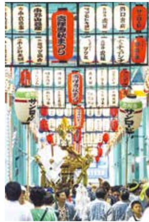
つなかりにぎわい・秋神輿

2月16日(金)~25日(日)/吉祥寺駅南北自由通路「はなこみち」に展示します/☎企画調整課オリンピック・パラリンピック担当☎60-1970