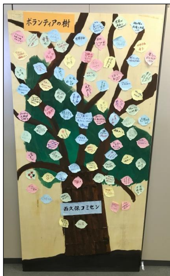
西久保コミセンで作成された 「ボランティアの樹」