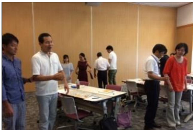
視覚障害者ガイドの体験