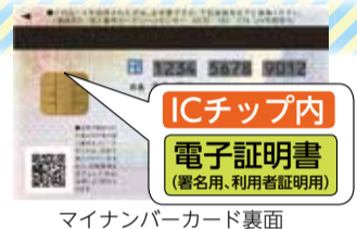
マイナンバーカード裏面

*マイナンバーカードの申請時に「利用者証明用電子証明書」は標準搭載されています。搭載しない申請をされた方はコンビニ交付の利用はできません。