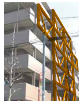
耐震改修事例(改修箇所は着色しています)

特定緊急輸送道路(井ノ頭通り、三鷹通り、中央通り(一部))に接している沿道建築物で、診断が義務付けられている建物の耐震化に要する費用を助成しています。詳しくは市ホームページ参照、または住宅対策課にお問い合わせください。