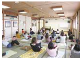
親子イベントに人気の大広間

3月には待望のエレベーターも完成し、階段が苦手な方にもスムーズに移動していただけるようになりました。さまざまな用途でのご来館をお待ちしています。