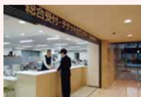
↑チケットカウンター