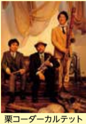
栗コーダーカルテット