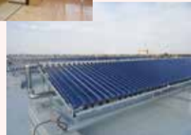
屋上に設置した太陽熱集熱器→