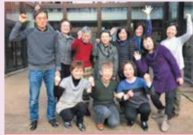
●大野田福祉の会が運営します どなたにもふらっと立ち寄りいただけ、集うみんながフラットな立場で過ごせる場所を目指しています。スタッフ一同お待ちしております。