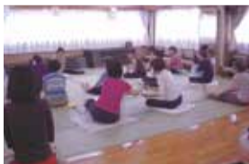
中町ストレッチ教室

コミセン主催の「小学生茶道教室」に加え、新たに「中町ストレッチ教室」と「料理教室」を立ち上げました。新規教室は指導して下さる方が地域にお住まいということもあり、アットホームな雰囲気の中で楽しめるという好評です。中町集会所で行うストレッチ教室は月2回を限度にフリー参加なので、日によっては会場が一杯になることもあります。料理教室は今年度分をすでに終了しましたが、リピーターが多く関心の高さがうかがえます。4年間続いている小学生茶道教室は、学年も学校も違う子どもたちが仲良くお稽古をしています。成長過程に日本の伝統文化に触れ体験することで、興味や理解が深まるとうれいそうですね。