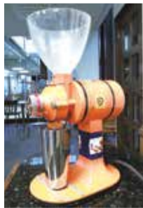
茶社のシンボル「コーヒーミル」

けやき茶社は月に1回、第3土曜日の午後2時から2時間だけオープンするコーヒーサロンです。コミュニティルームは即席の喫茶店に早変わりし、コーヒーや中国茶を楽しむ人たちが賑やかになります。傍らでゲームを楽しむ子どもたちにスイーツのおすそわけがあることも。大きなテーブルをシェアすると、知らない人とでも自然に話が始められます。小さい館ならではの光景ですが、静かにゆっくりお茶を楽しみたい人は2時台がおすすです。館内の出前もしています。