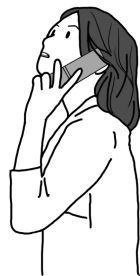
【イラスト】 きたもりちか