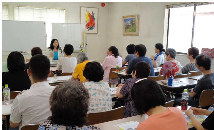
【近代になって恋愛、子ども、家庭…次々と概念が発見されました】