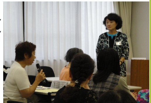
▼【これは良かったという事例は何ですか?】