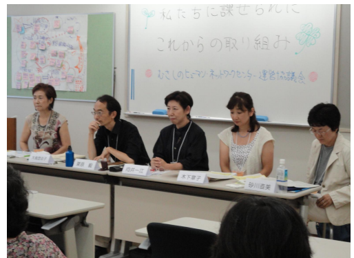
▲【フロアからの質問を受けるメンバー】

当日の様様については、9月22日(水)午後6時30分、センター会議室で市民の方々に向けて報告会を開きました。