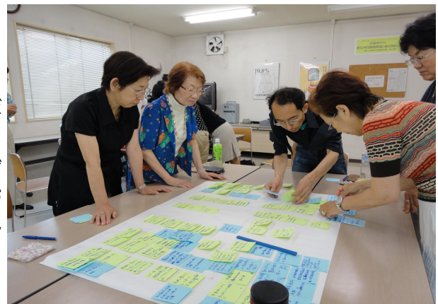
【これはこちらに…。まとめに懸命な委員たち】

ただ理念を話すばかりでは先に進めない、言い放ちだけに終わらせないと、互いの共通認識を図り、一つひとつ確認しながら具体的に課題解決に向かおうと、それぞれが自らを問いながら前向きに取り組みました。そのおかげで少しずつ改善されて来た明るい部分もあり、これからが期待できます。