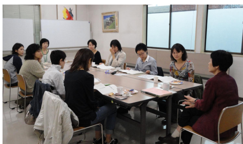
【また集まりましょう。賛成！…話はずむ】

2010年5月から6月にかけて実施した6回連続講座「暮らしの女性学2010」の学習記録誌が完成しました。9月28日(火)に受講生が集まり、できあがった学習記録誌を手に、歓談しました。「子どもが寝た後など、自分一人の時間に、何度も読み返したい」「休んだ日も、記録を読めば理解が進むので嬉しい」「この言葉を人に伝えたいと思っていたので、記録誌で再確認できてよかった」「今回のような保育付きの女性の生き方を考える講座はずっと続けてほしい」