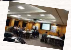
グループワークのようす

*いただいたご意見をもとに、今後検討を進めていきます。ご参加いただきありがとうございました。