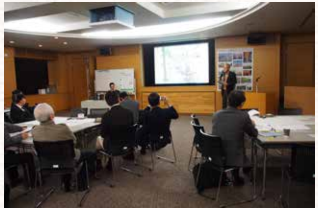
情報提供のようす

また、柵やガードレールの色彩、デザインの工夫や、電柱・電線の地中化によって景観を改善する方法、花と緑を活かして市民が憩える景観をつくるポイントなどを、事例写真を使いながらお話いただいた他、「マイナスの景観はゼロに戻し、プラスにしていく必要がある」といったまとめをいただきました。