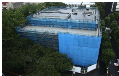
木に囲まれた外観の様子

建物内部もどんどん出来上がってきました。開館が楽しみです☆また11月6日からプレイス周辺でイルミネーションが始まるみたいです☆