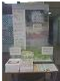
境南コミセンにて

現在は西部図書館で、11月10日から市民会館で行う予定です。次はあなたの地域へ・・・？展示場所では、プレイスの概要を載せたブックレットも配布しています。