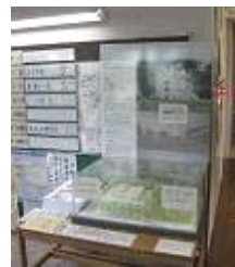
西部コミセンにて