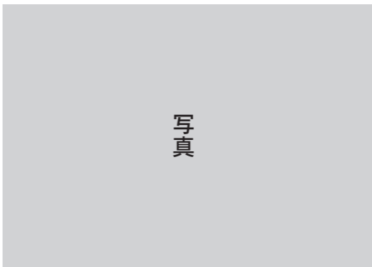
シェルター、センターへの紹介もしていますので、気軽に電話してください。