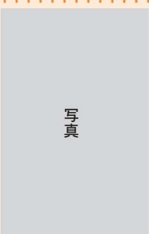
食べ歩きのひとつまー吉祥寺にてー