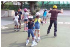
インラインスケート教室