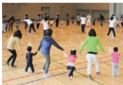
スポーツ教室 親子体操