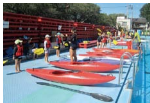
オリパライベント(カヌー体験)