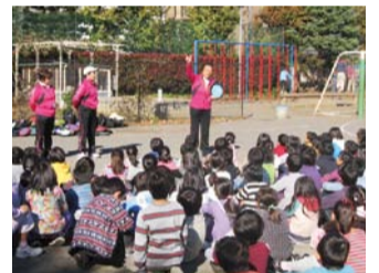
スポーツ推進委員によるドッジビー体験教室(大野田小)