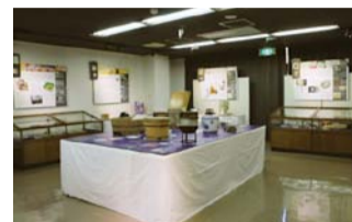
☎ 武蔵野ふるさと歴史館

期 間 4月24日(日)まで 会 場 武蔵野ふるさと歴史館 第二展示室(企画展示室) 開館時間 9:30～17:00 入館無料 休 館 金・土・祝日