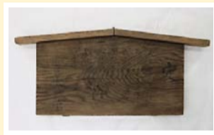
所在地 武蔵野市 蔵

五日市街道沿いに建つ井口家には、江戸時代から明治時代にかけて掲げられた高札5枚が残されています。