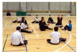
障害者スポーツ(シッティングバレーボール)