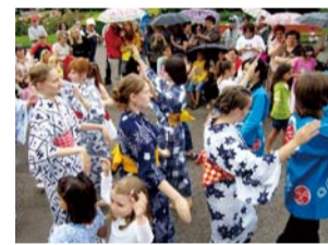
浴衣を着てお祭り

これから、東京2020大会に向けてこのブラショフ市があるルーマニア国を武蔵野市として応援し、文化・スポーツ相互交流を実施していきます。