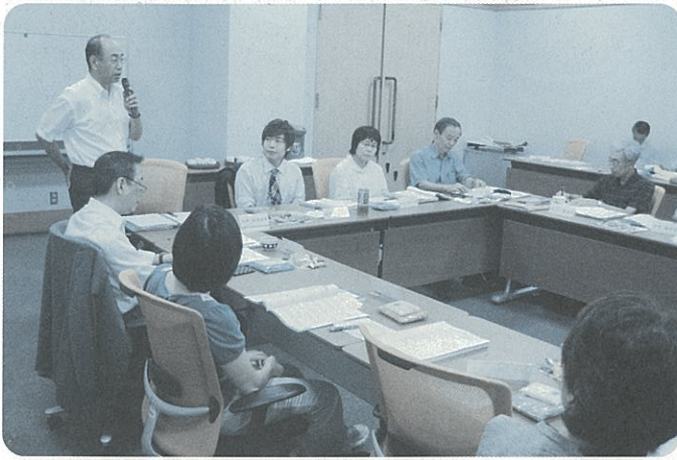
ごみ減量協議会の様子

本紙の見開きページに掲載されている「ごみ処理基本計画」を実現させるためには、一般家庭から排出されるごみ・資源物の減量を進めていかなくてはなりません。このため平成19年9月より市民・事業者・行政で、ごみ減量を具体化していくための協議会を発足しました。