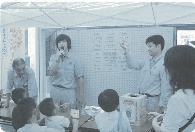
平成20年10月のマイバックキャンペーンの様子

レジ袋は使い捨てになってしまいうケースが多くあります。買い物にはマイバッグを持参し、レジ袋を断るだけで、ごみの減量やCO 2 の削減につながります。レジ袋は年間一人あたり約300枚使用していると言われていています。20ℓのレジ袋の重さは約10グラムあり、これが減ることによりごみの減量につながります。レジ袋を断ることをきっかけに必要なものはもらわないという意識を持ち、より一層のごみ減量を心がけ、使い捨てのライフスタイルを見直しましょう。