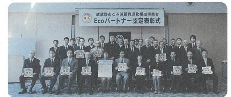
平成19年度 認定表彰式