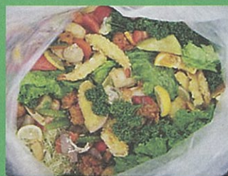
生ごみ分別の徹底