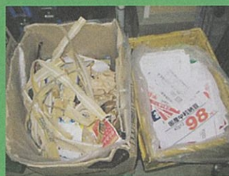
紙資源分別の徹底