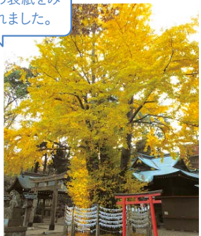
撮影地：杵築大社