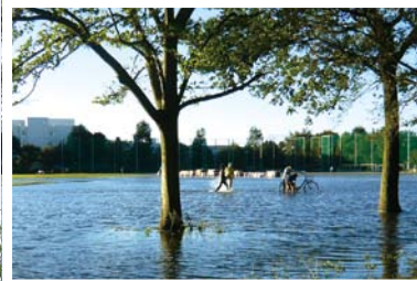
撮影地：武蔵野中央公園