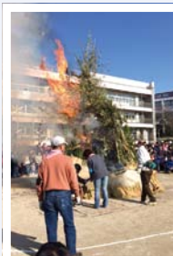
撮影地：桜野小学校 投稿者：あーちゃんママ