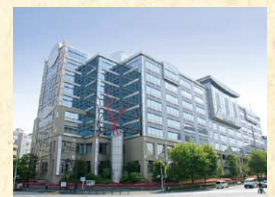
かつての吉祥寺があったエリアには、現在、都立工芸高校やビルが建ち並ぶ(文京区本郷)。

側、JR中央線の車窓からも眺めることができる都立工芸高校付近にあります。当時の吉祥寺付近は門前町としてにぎわいました。