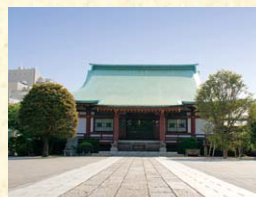
東京大空襲被害を免れた山門と経蔵が当時をしのばせる現在の吉祥寺(文京区本駒込3-19-17)。