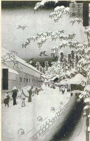
歌川廣重による浮世絵「江戸名所百景 愛宕下 藪小路」。