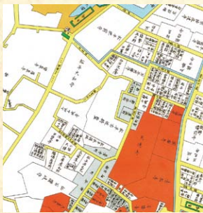
江戸期の西久保城山町付近の地図。『増補 港区近代沿革図集』(出典は『御府内往還其外沿革図書』)より。