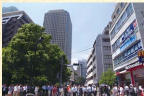
東京メトロ日比谷線神谷町駅周辺が、かつての西久保城山町にあたる。城山トラストタワーがそびえ立つ(港区虎ノ門四丁目)。