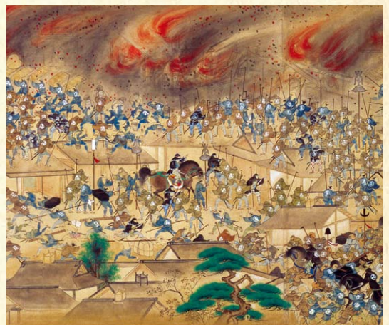
明暦の大火の様子を描いた「江戸火事図巻」。明暦3年、本郷丸山から出火したといわれる火事は江戸の町を焼き尽くす大火となった。

武蔵野市にある吉祥寺のまちなみは、吉祥寺という寺院に由来しています。この吉祥寺とは江戸時代の大寺であり、江戸城築城の際、井戸を掘った場所から「吉祥増上」の刻印が出てきたため、城内(現在の千代田区の和田倉門周辺)に「吉祥庵」を建てたのが始まりです。その後、吉祥寺として本郷元町(現在の文京区)に移りました。現在の水道橋の北