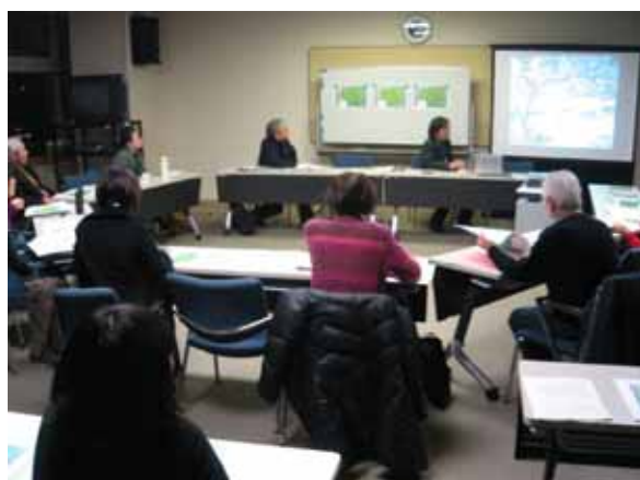
事務局から計画図案の説明をしました