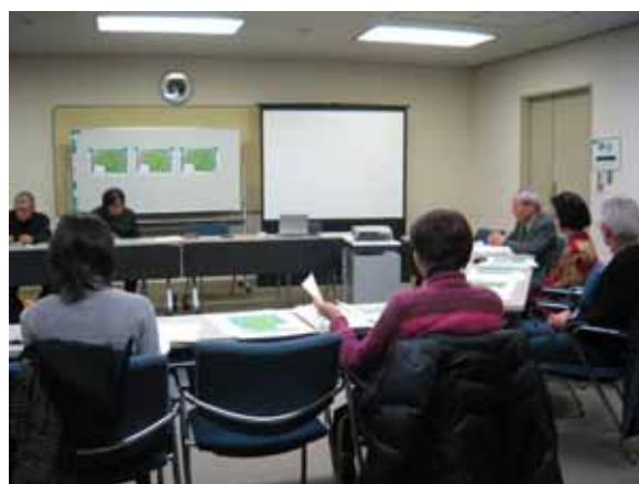
全員が意見を述べディスカッションしました